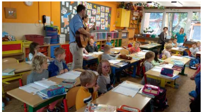
Kdo si zpívá, je mu hej