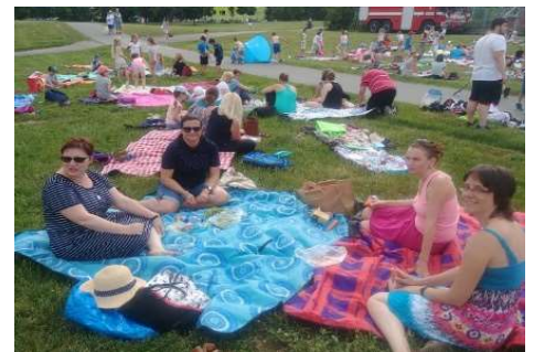
Rozloučení se školou